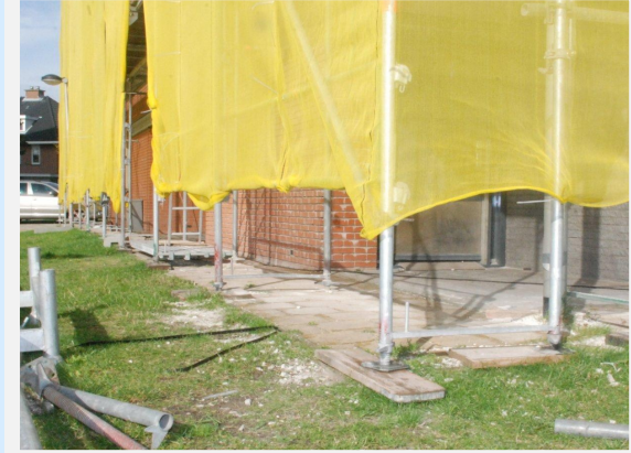
te smal tegelpad.....

voor de scootmobielen die nu nog noodzakelijkerwijze in de halletjes voor de woning worden geparkeerd. Het mes zou dan immers van twee kanten snijden. Het is toch al gebrekkig manoevreren in de smalle ruimten en in de lift en het zou bovendien onnodige beschadigingen kunnen voorkomen. En over smal gesproken. Het tegelpad aan de achter