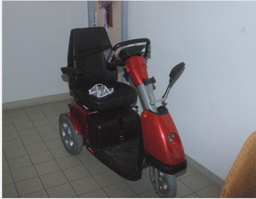
Scootmobiel in de gang